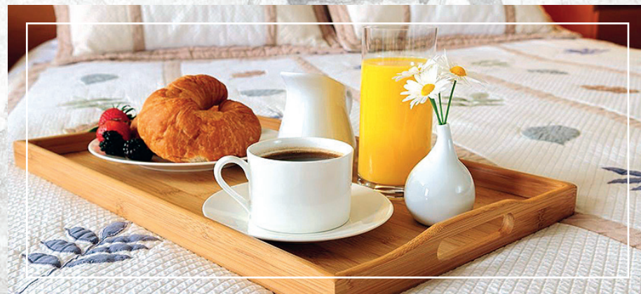
Завтраки в парк-отеле «Вознесенская слобода».