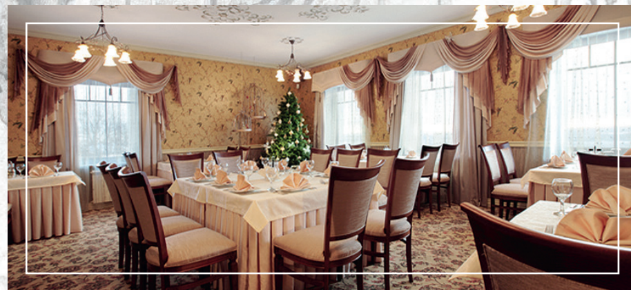
Новогодний банкет с развлекательной программой.