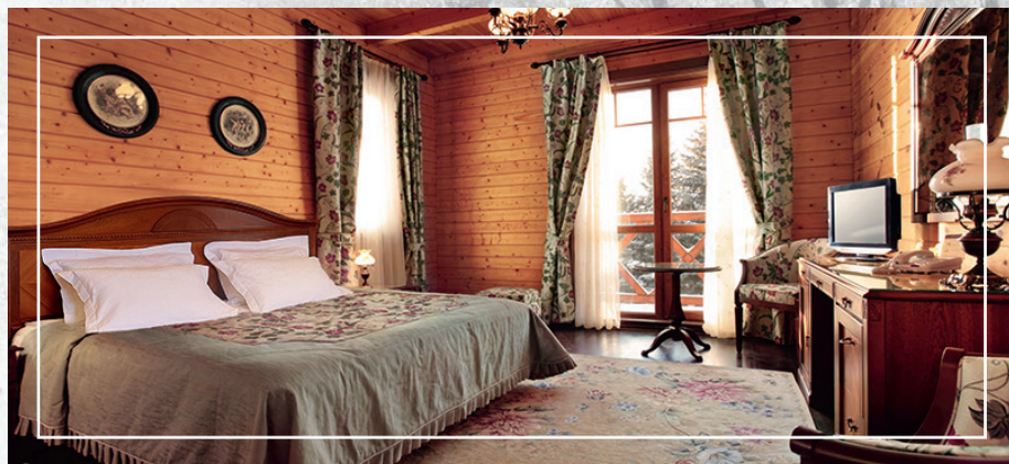
Двухместное размещение в парк-отеле «Вознесенская слобода».