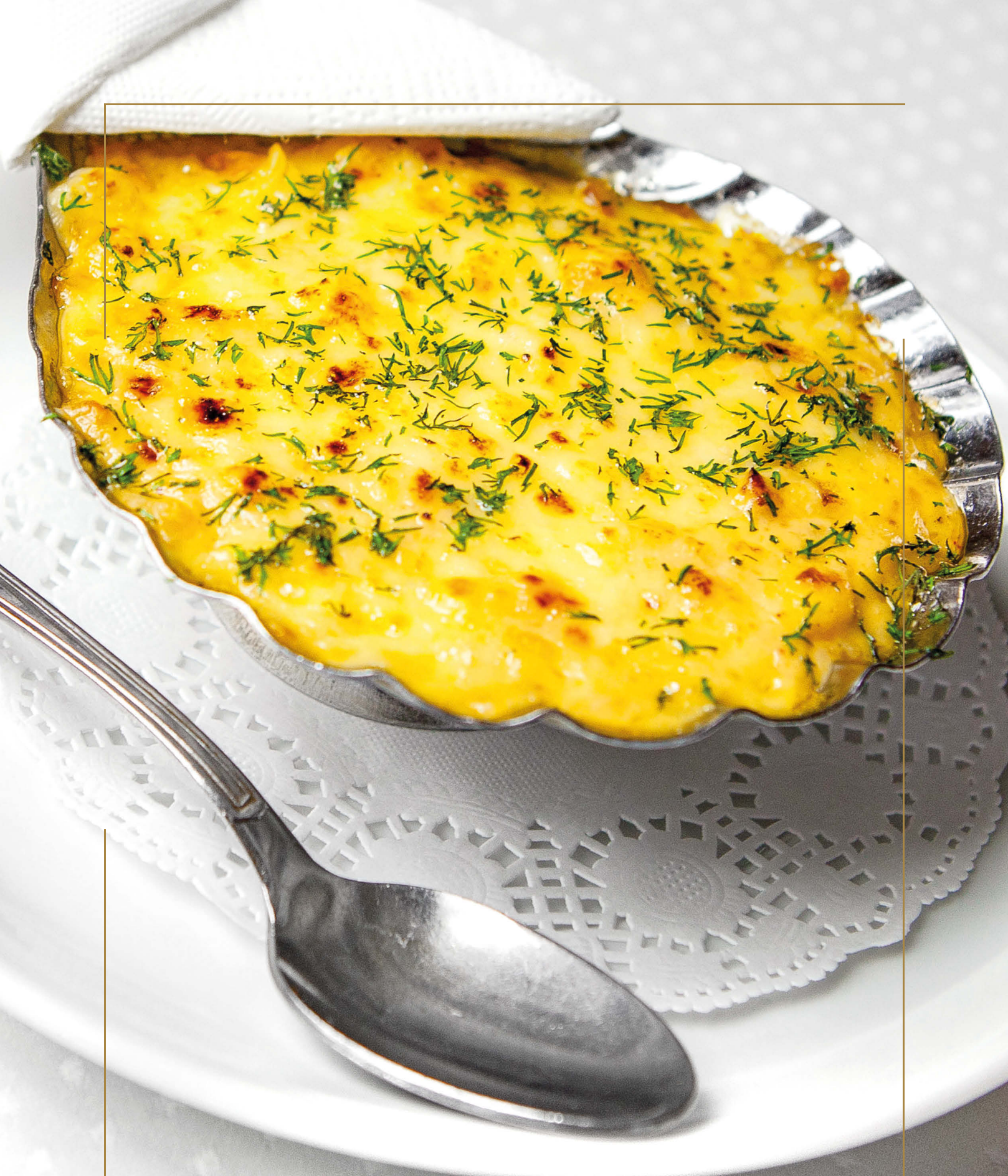
РЫБНЫЙ КОКОТ ПОД СОУСОМ «КРЕВЕТОЧНЫЙ БИСК»