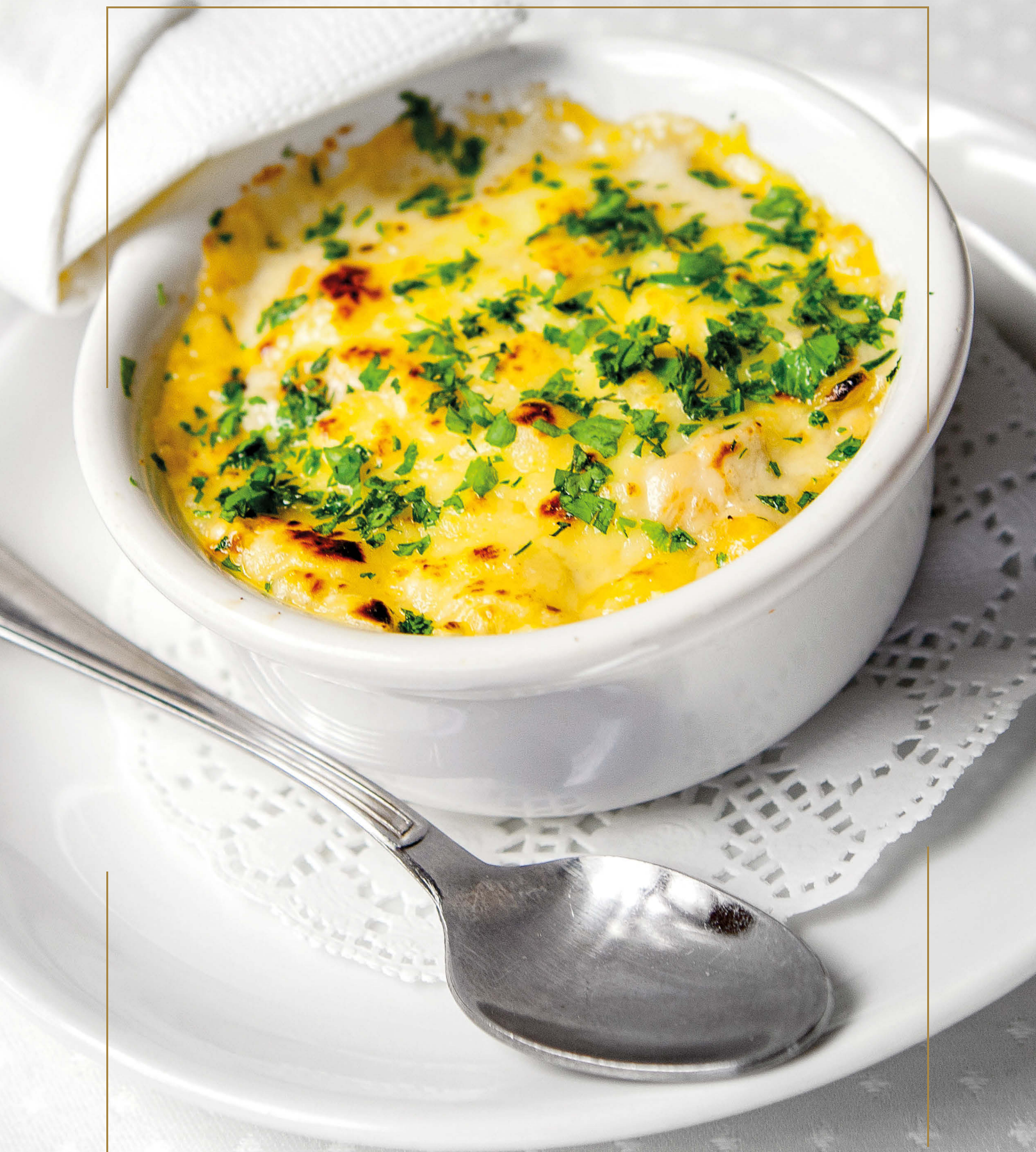
ЖУЛЬЕН С КУРИЦЕЙ И ГРИБАМИ