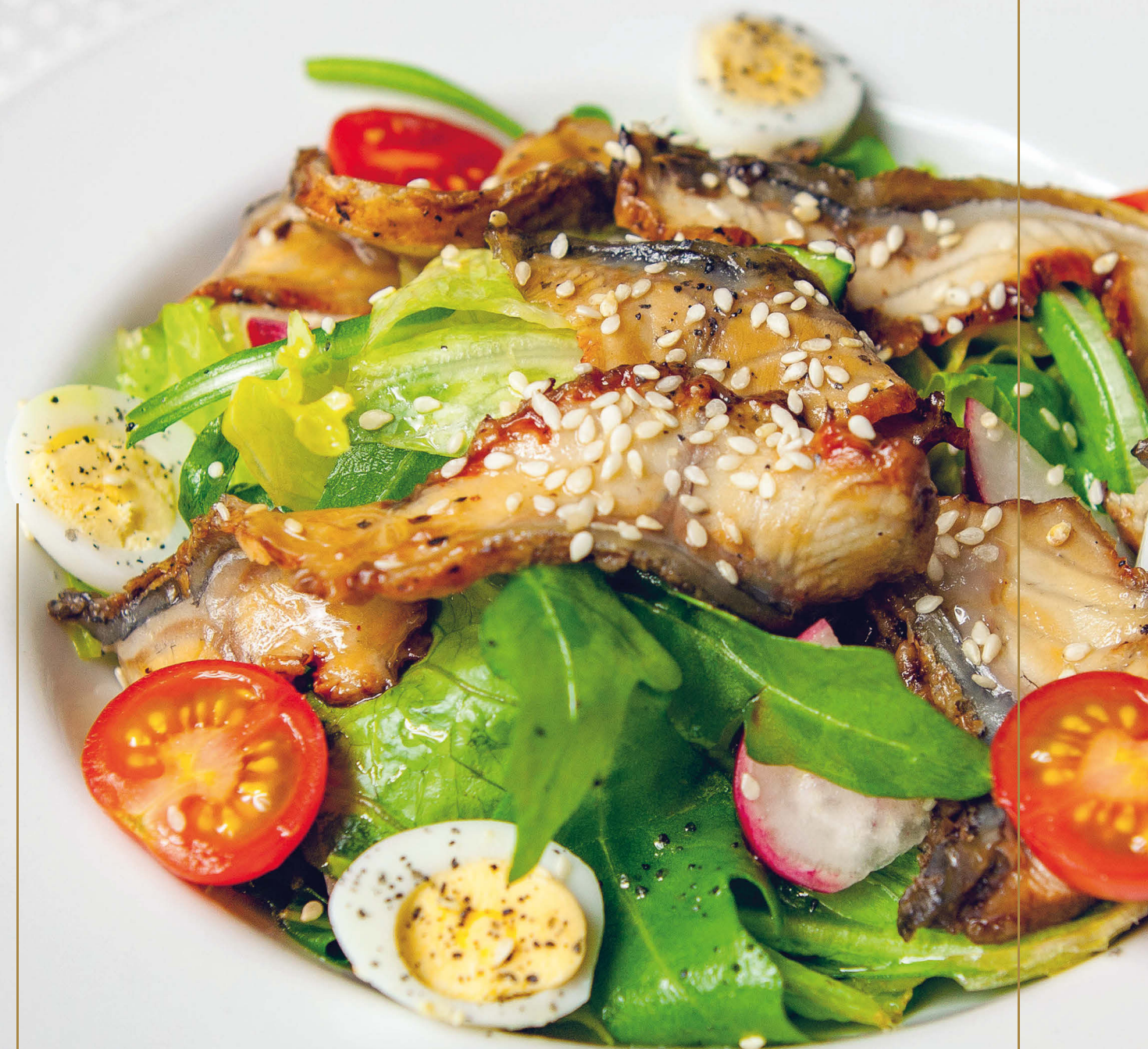
ЛЕГКИЙ САЛАТ С УГРЕМ