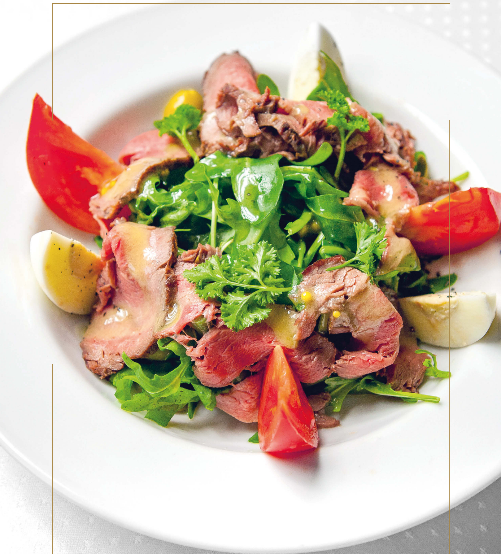
САЛАТ «НИСУАЗ» С КОПЧЕНЫМ РОСТБИФОМ